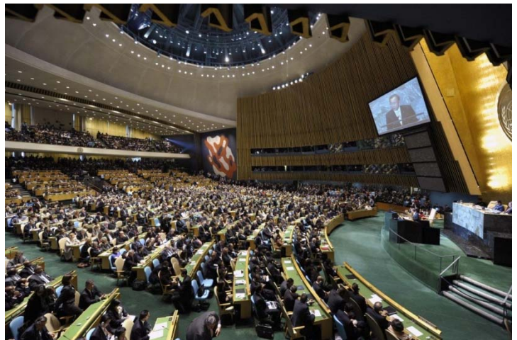
Ilustración 1: Asamblea General en New York el 19 de septiembre de 2016

El aplazamiento de las posibles soluciones efectivas hasta el 2018 y la falta de reconocimiento por parte de los principales Estados acerca de su responsabilidad en relación a la crisis migratoria, empañaron la potencialidad del encuentro. A pesar de ello, la Cumbre en si misma ha tenido impacto político y principalmente ha mostrado la necesidad de abordar con la misma seriedad y en la misma proporción a los migrantes y a los refugiados, a pesar de que aún el debate sobre categorías de protección internacional que sean efectivas y den respuesta a las verdaderas características y necesidades de las movilidades actuales este lejos de ocurrir.