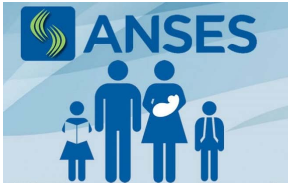
Ilustración 5: Logo de la ANSES 20

Entre los requisitos fijados para acceder a la AUH, el decreto 1602/09 establece que el niño sea argentino, hijo de argentino nativo o por opción, naturalizado o residente con residencia legal en el país no inferior a tres años previos a la solicitud y acreditar la identidad del beneficiario y del niño, mediante el Documento Nacional de Identidad. Según esta redacción, parecería que los padres deberían ser residentes en el país, con una antigüedad de al menos tres años. Por otro lado, es preciso tener el DNI argentino 19 . Entonces, el carácter -universal- de esta asignación tiene sus limitaciones, particularmente la exclusión de la AUH con base en los años de residencia en el país de los padres.