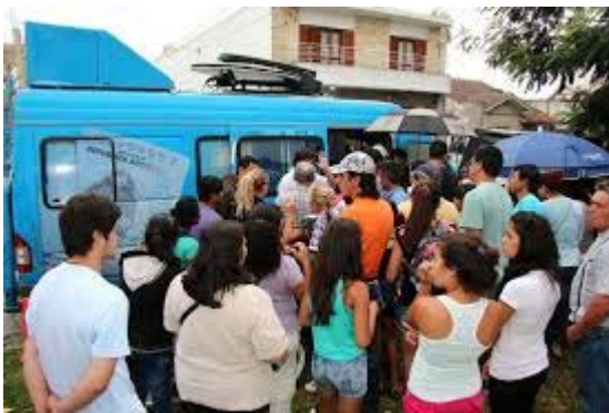
Ilustración 2: Camión de la campaña en territorio

Este programa formaba parte de una estrategia de aproximación territorial a los migrantes. La estrategia era acercarse a las áreas periféricas para atender de forma personalizada a los migrantes con miras a facilitar la regularización, al mismo tiempo que se informaba de sus derechos. El rol de las organizaciones de migrantes era fundamental ya que eran éstas en la mayor parte de los casos quienes solicitaban a la DNM – aunque podía ser por un pedido personal–se acercaba al territorio.