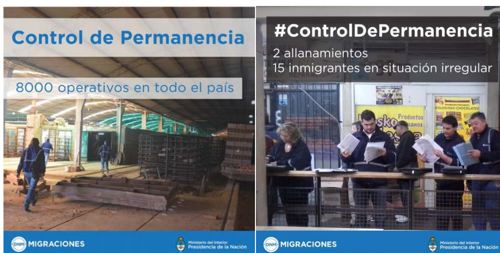
Ilustración 4: Imágenes tomadas del Twitter de la DNM, septiembre 2016

A partir de las reacciones contra la creación del centro de detención de migrantes y la acusación de una mirada criminalizadora de las migraciones, el tono de las comunicaciones cambió tratando de minimizar el sesgo de control y acentuando el de prevención de posibles víctimas de trata laboral y/o sexual. De las propias campañas se desprende sin embargo, que la intencionalidad no se orienta realmente a contrarrestar este flagelo sino a visibilizar el despliegue punitivo, copiando obsoletas prácticas de control social de otros países y que no solo han sido cuestionadas sino infructuosas.