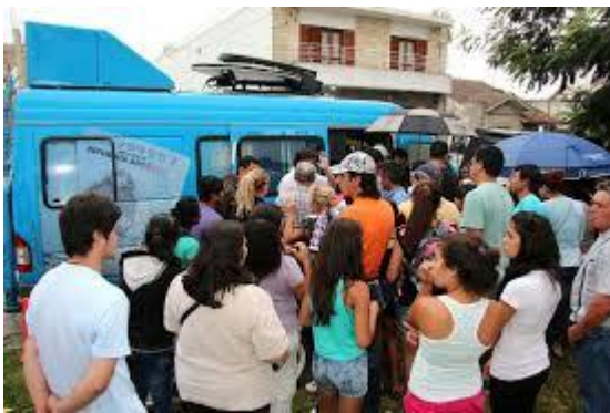
Ilustración 2: Camión de la campaña en territorio

Este programa formaba parte de una estrategia de aproximación territorial a los migrantes. La estrategia era acercarse a las áreas periféricas para atender de forma personalizada a los migrantes con miras a facilitar la regularización, al mismo tiempo que se informaba de sus derechos. El rol de las organizaciones de migrantes era fundamental ya que eran éstas en la mayor parte de los casos quienes solicitaban a la DNM – aunque podía ser por un pedido personal–se acercaba al territorio.