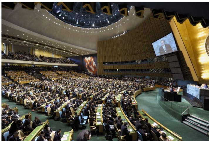
Ilustración 1: Asamblea General en New York el 19 de septiembre de 2016

El aplazamiento de las posibles soluciones efectivas hasta el 2018 y la falta de reconocimiento por parte de los principales Estados acerca de su responsabilidad en relación a la crisis migratoria, empañaron la potencialidad del encuentro. A pesar de ello, la Cumbre en si misma ha tenido impacto político y principalmente ha mostrado la necesidad de abordar con la misma seriedad y en la misma proporción a los migrantes y a los refugiados, a pesar de que aún el debate sobre categorías de protección internacional que sean efectivas y den respuesta a las verdaderas características y necesidades de las movilidades actuales este lejos de ocurrir.