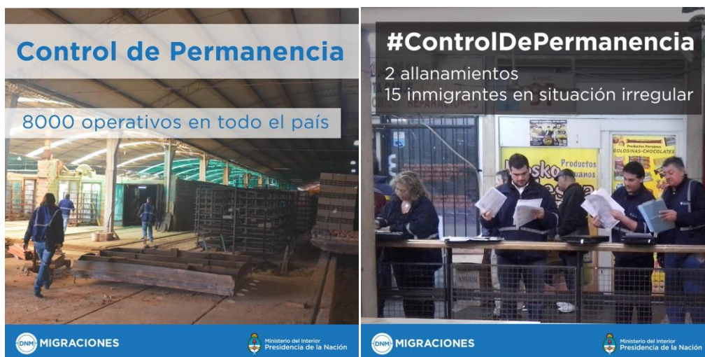
Ilustración 4: Imágenes tomadas del Twitter de la DNM, septiembre 2016

A partir de las reacciones contra la creación del centro de detención de migrantes y la acusación de una mirada criminalizadora de las migraciones, el tono de las comunicaciones cambió tratando de minimizar el sesgo de control y acentuando el de prevención de posibles víctimas de trata laboral y/o sexual. De las propias campañas se desprende sin embargo, que la intencionalidad no se orienta realmente a contrarrestar este flagelo sino a visibilizar el despliegue punitivo, copiando obsoletas prácticas de control social de otros países y que no solo han sido cuestionadas sino infructuosas.